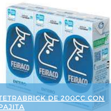
TETRABRICK DE 200CC CON PAJITA