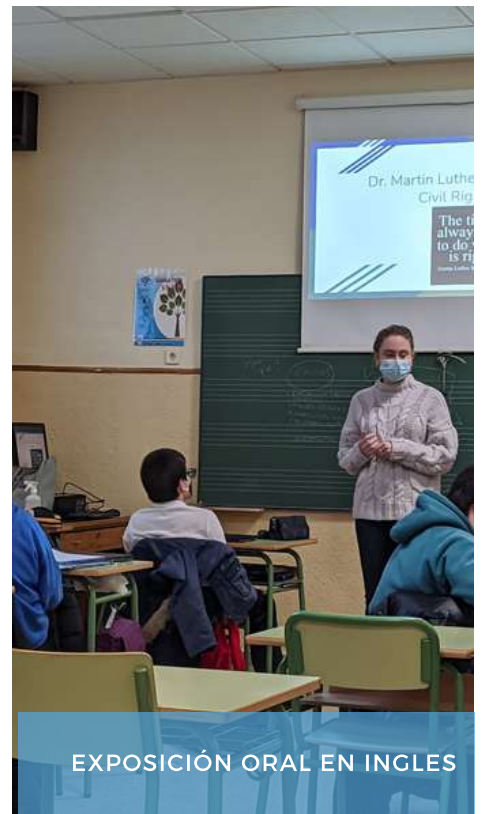
EXPOSICIÓN ORAL EN INGLES